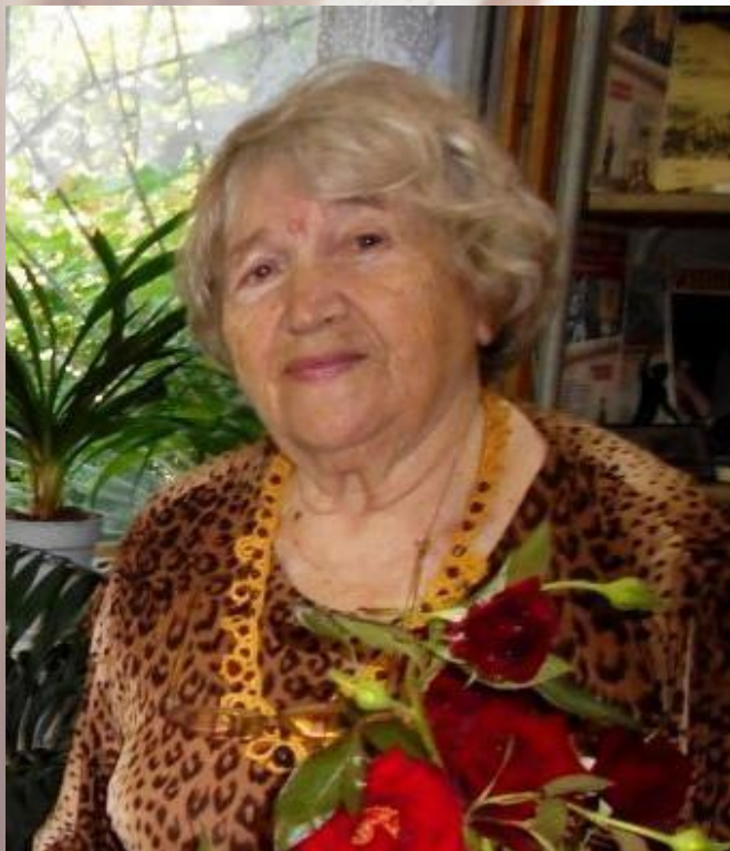
Тамара Обринская (23 июня 1934г.- 09 апреля 2023г.)

23 июня исполняется 90 лет со дня рождения Тамары Обринской - композитора, поэта, писателя, автора детских игровых программ, мастера плетения в технике фриволите.