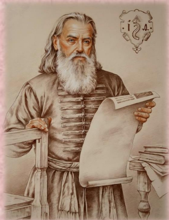
Иван Федоров (Москвитин)

Человека, первого НАПЕЧАТАВШЕГО «Азбуку» на славянском языке звали - Иван