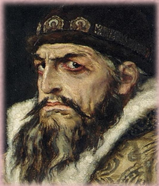
Царь Иван IV

царь Иван IV (четвертый); для этой цели начали искать мастеров печатного дела. По его приказу в Москве был устроен дом — Печатный двор, руководить которым был поставлен Иван Федоров. А оказался он там не случайно - Иван был человеком грамотным образованным. И