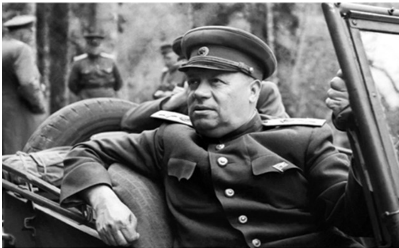
Командующий 4-м Украинским фронтом генерал армии Федор Толбухин

8 апреля 1944 года войска 4-го Украинского фронта под командованием генерала армии Федора Толбухина во взаимодействии с Черноморским флотом под командованием адмирала Филиппа Октябрьского, Азовской военной флотилией под командованием контр-адмирала Сергея Горшкова и крымскими партизанами начали Крымскую операцию. Войска фронта при поддержке авиации 8-й воздушной армии и авиации Черноморского флота перешли в наступление.