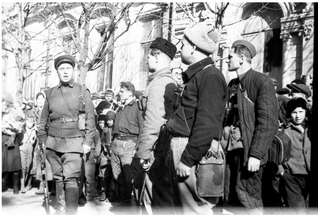
Партизаны в центре освобождённого Симферополя

В период оккупации города подпольщики вели постоянную борьбу с захватчиками. Они не только устанавливали связи с крымскими партизанами, передавали им данные для диверсий, сообщали о подготовке карательных операций, но и сами не раз проводили диверсии.